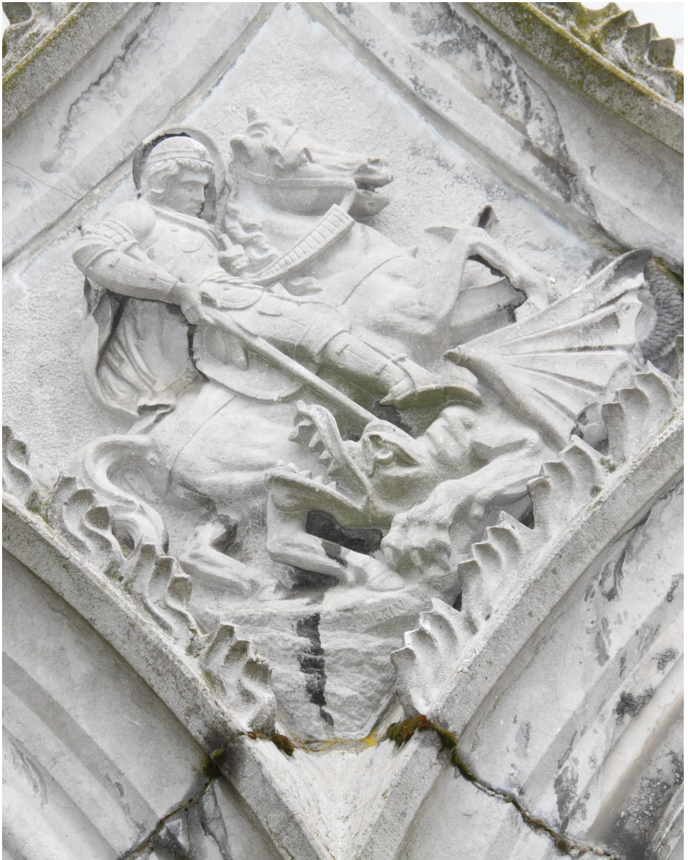
Église Saint-Georges, collégiale de Limbourg