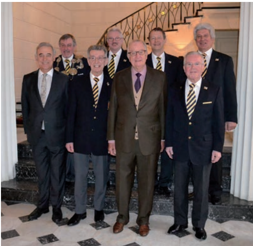
Janvier 2015 : le roi Albert reçoit les dignitaires de la Gilde