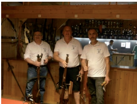
Championnat de Belgique

Le dimanche 29 mai vit l'ouverture de la saison du tir d'été, où une sympathique assemblée répondit présent.