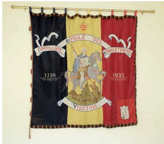
Drapeau national de 1923