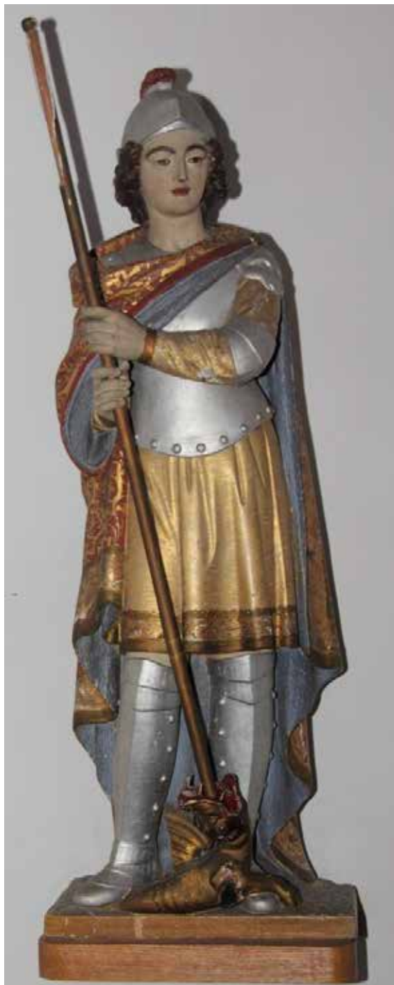
Eglise Saint-Georges d'Henri-Chapelle. Statue en bois polychrome du XVIII ème .