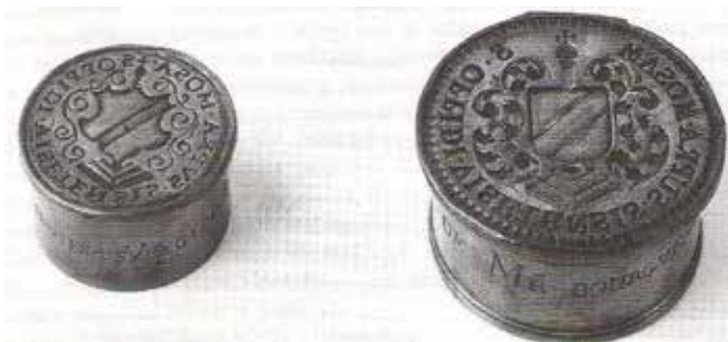
Sceaux des bourgmestres et conseil de la ville, « Les plus anciennes rues », T. 10, p.498.

Aussi, l'acte du 16 juillet 1384 accordant l'autonomie communale à Visé et exigeant sa soumission à la Cité, fut-il détruit. Entre le 23 septembre 1408 et le 9 avril 1429, Visé fut de nouveau administrée par les Maires et Echevins, dépendant du prince.