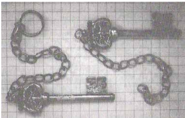
Les clés magistrales, J. Knapen, t. 4, p. 182, fig. 71.

Leurs pouvoirs connurent cependant des modifications au cours des siècles, surtout aux XVII ème et XVIII ème siècles quand les princes-évêques de Bavière imposèrent un régime absolutiste et quasi monarchique, avec succession d'oncle à neveu.