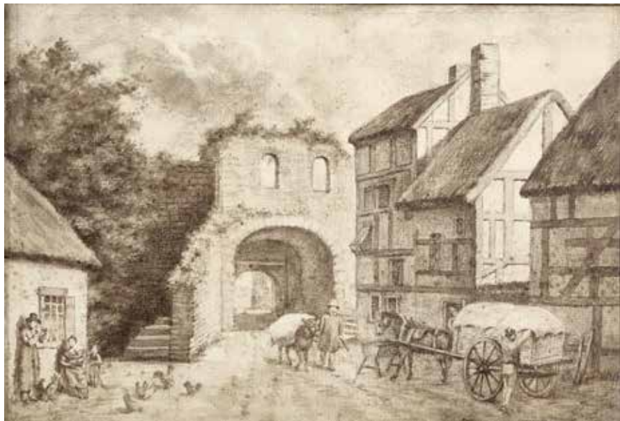
J. KNAEPEN, Les rues de Visé, t. 10, p. 24, fig. 10, La porte Postice.

B. DEMOULIN et J.L. KUPPER, Histoire de la Principauté de Liège, Toulouse, Ed. Privat, 2002.